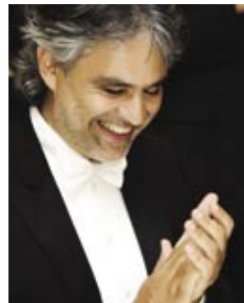
■ Andrea Bocelli

Andrea Bocelli brillerà sulla Walk of Fame di Hollywood tra le stelle della musica. Il 2 marzo 2010 la targa in suo onore sarà scoperta durante la settima festa del cinema Los Angeles-Italia. Insieme saranno svelate le stelle dei musicisti Ringo Starr, Bryan Adams e Van Morrison, degli attori Russell Crowe, Emma Thompson e Colin Firth e del regista James Cameron. Gli italiani che hanno ottenuto questo onore sono: Bernardo Bertolucci, Sophia Loren, Rodolfo Valentino, Anna Magnani, Arturo Toscanini ed Enrico Caruso.