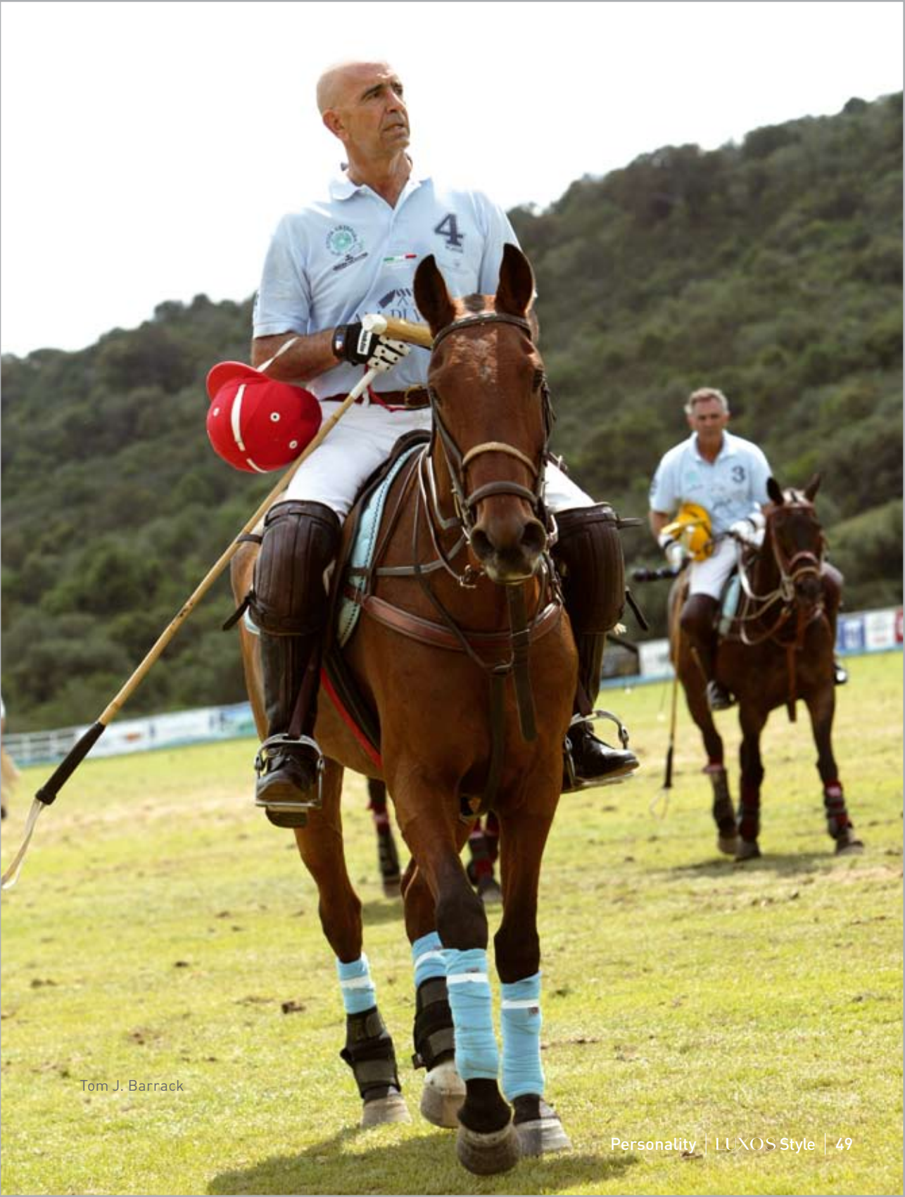
Tom J. Barrack