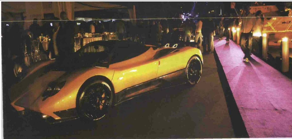
■ Alcuni momenti della due giorni sarda organizzata dall'imprenditore statunitense Tom Barrack (nella foto in basso a destra)