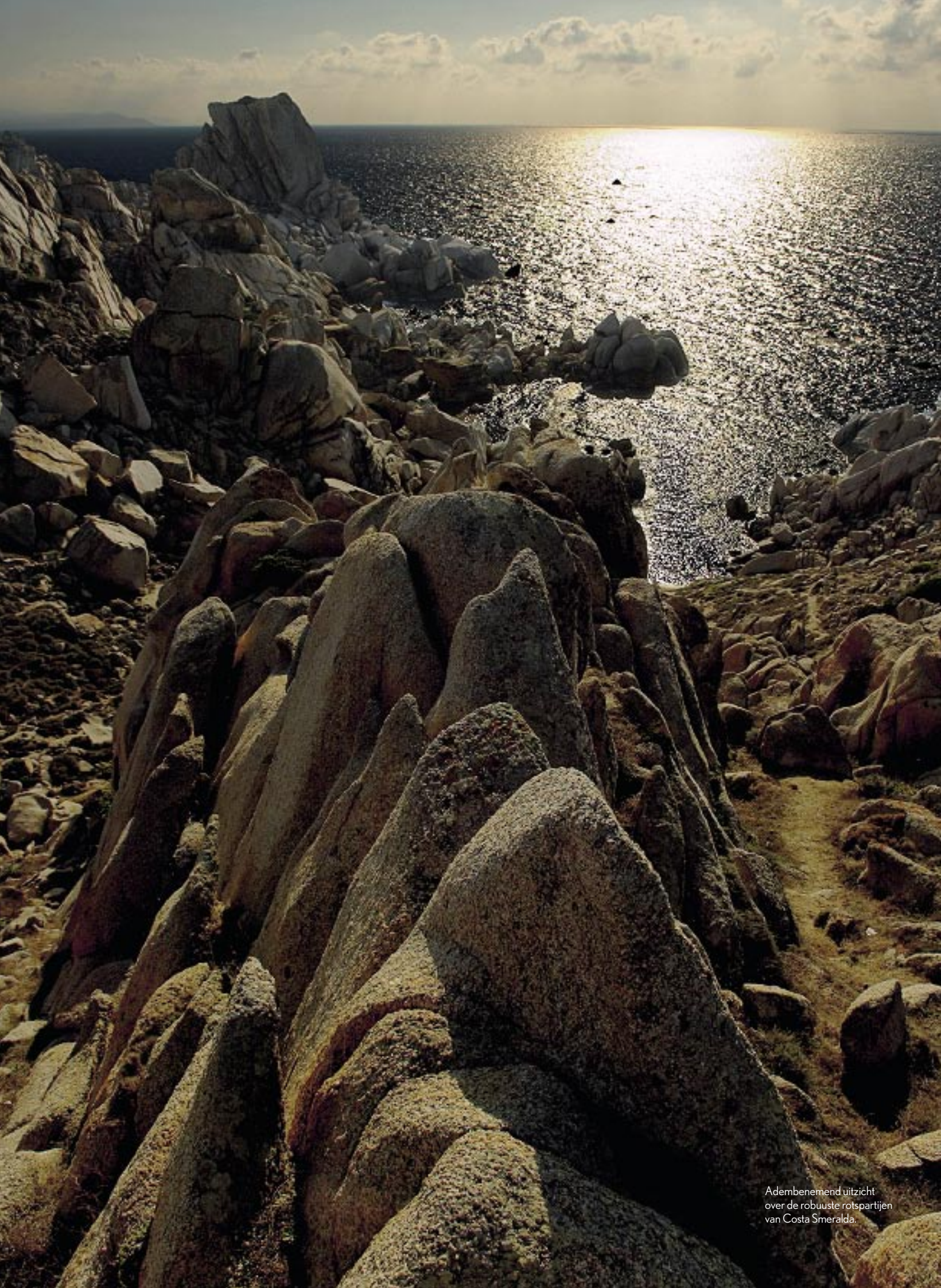
Adembenemd uitzicht over de robuuste rotspartijen van Costa Smeralda.