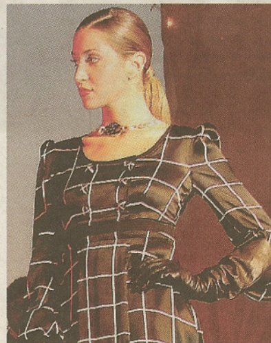
Una modella nelle sfilate di De Luxe

le, lo spazio è tutto per il padrone di casa Tom Barrack, il miliardario californiano di origine libanese a cui Aga Khan ha ceduto lo scettro, ritirandosi poi nella castello dorato dello Yacht Club. Lui si sminuisce: «Non sono il proprietario della Costa Smeralda, ma soltanto il custode». Non c'è male, detto dal più ricco immobiliare del mondo, proprietario di catene di grandi alberghi, della Tamoil e di tantissimi asset finanziari.