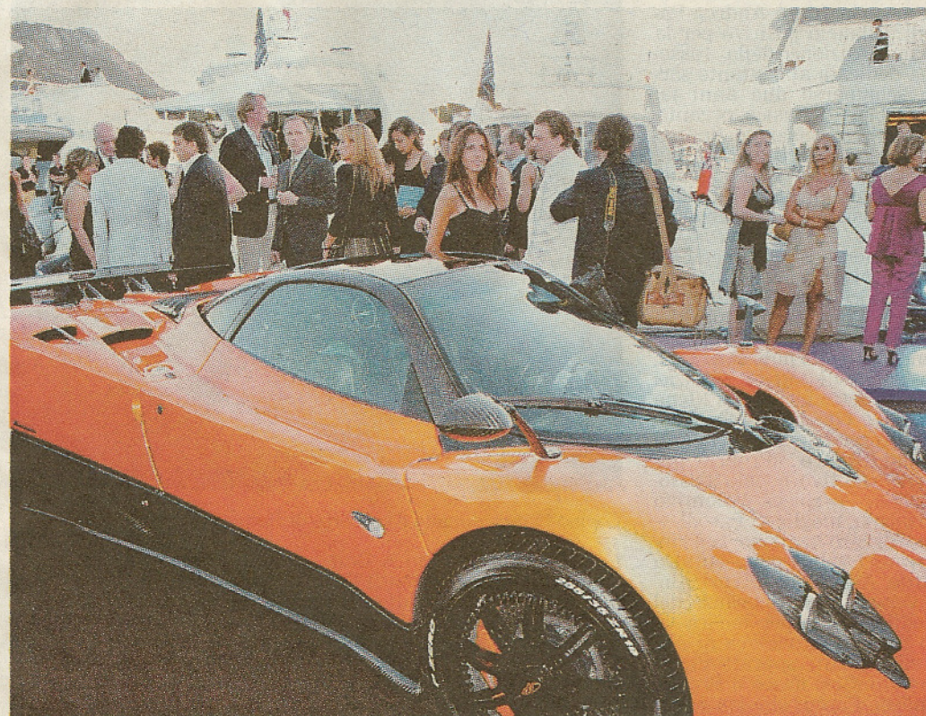
Alanis Morissette sul palco del Deluxe a Porto Cervo e un momento della manifestazione

Nella notte più esclusiva dell'estate in Costa Smeralda,