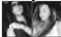
Corona e la ex moglie Nina Moric

MILANO — Fabrizio Corona e Nina Moric si sono separati ieri davanti al tribunale di Milano. L'istanza era stata presentata dalla modella croata poche settimane dopo l'arresto del fotografo nell'ambito dell'inchiesta «Vallettopoli». «La riconquisterò», ha detto Corona